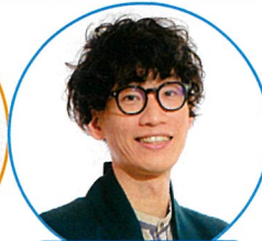
もりやすパンパンピカロ