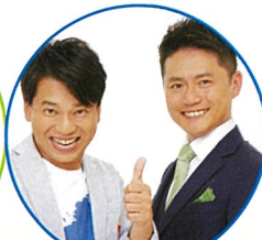
ファミリーレストラン